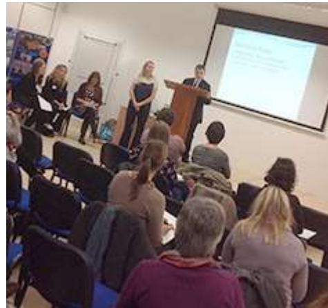
Abertillery and Holyhead Pupil Language Ambassadors impress the crowd with their MFL promotional activities

Mae cyflwyniadau'r prif siaradwyr a deunydd fideo ar gael bellach i chi eu lawrlwytho a'u gwyllo yma ar wefan CILT Cymru .