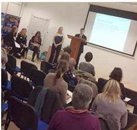
Llysgenhadon Iaith Abertyleri a Chaergybi yn ennill edmygedd y dorf gyda'u gweithgareddau i hyrwyddo ITM